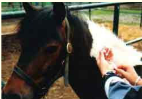
impfungen erfolgen, anders als auf diesem bild zu sehen, zumeist in einen der beiden brustmuskeln.